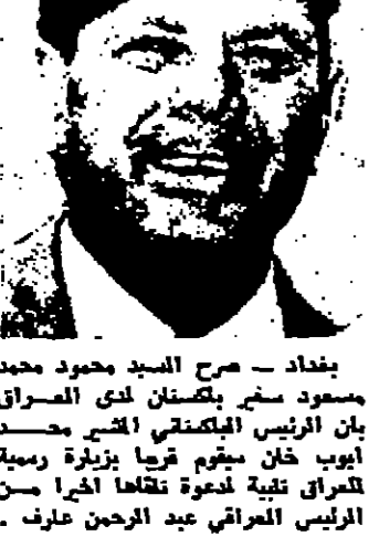
الرئيس ايوب خان يزور العراق قريبا

وزير الثقافة والاعلام عاد الى عمان عمان - عاد الى عمان مساء امس السيد صلاح ابو زيد وزير الثقافة والاعلام قادما من لندن بعد زيارة خاصة استغرقت بضعة ايام اجرت له خلالها فحوص طبية . وكان في استقباله في المطار عدد من الوزراء وكبار موظفي وزارة الثقافة والاعلام .